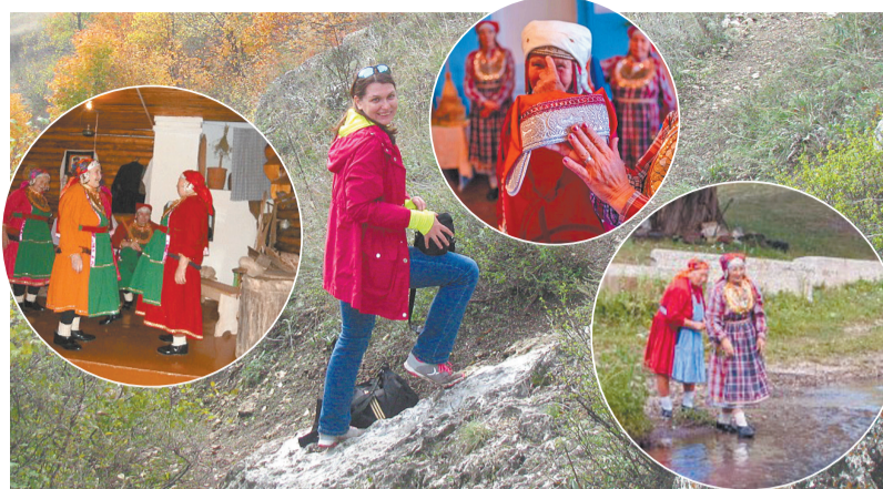
И в родном крае немало удивительных и интересных для отдыха мест.