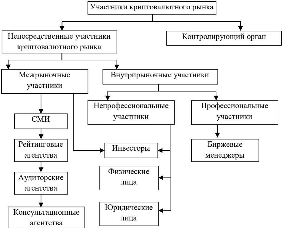
Рисунок 3 - Авторское видение инфраструктуры сферы функционирования криптовалюты в Российской Федерации

и физическими лицами. Однако в случае с банковскими переводами стандартные тарифы базируются на денежном выражении сделок в течение календарного месяца, в то время как на сделки с криптовалютой предлагается установить дневной лимит в размерах 100 000 руб. для малых расчетов и 200 000 руб. для средних расчетов;