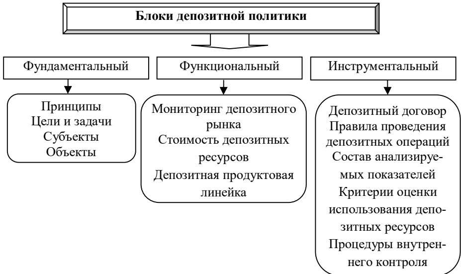
Рисунок 1 – Блоки и элементы депозитной политики коммерческих банков

2) функциональный блок - объединяет направления депозитной политики по привлечению ресурсов;