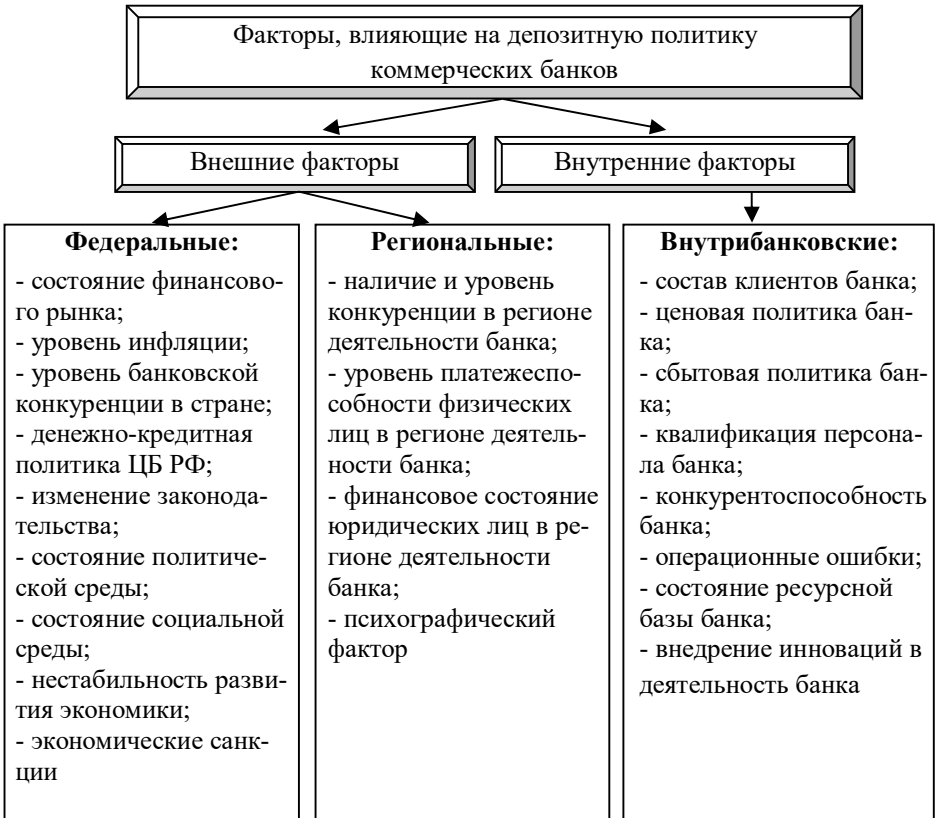
Рисунок 2 - Факторы, оказывающее влияние на формирование и реализацию депозитной политики коммерческих банков

Обоснование научных положений депозитной политики коммерческих банков позволило разработать алгоритм формирования и реализации депозитной политики коммерческих банков, определить состав Положения о депозитной политике и разработать практические рекомендации по оценке качества депозитных услуг. Этому посвящено следующее направление исследования.